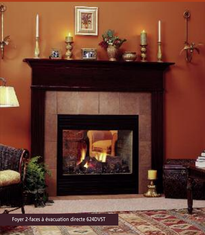
Foyer 2-faces à évacuation directe 624DVST