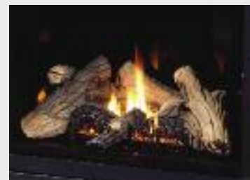
Bûches montrées avec panneaux en porcelaine noire