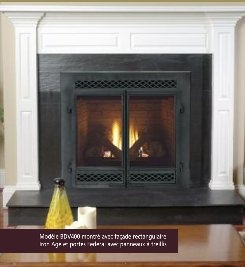
Modèle BDV400 montré avec façade rectangulaire Iron Age et portes Federal avec panneaux à treillis