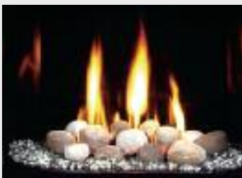
Brûleur avec pierre et verre