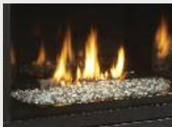
Brûleur avec verre