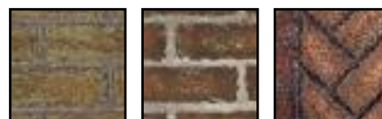
Briques réfractaires « Cottage Clay » Briques réfractaires « Cottage Red » Briques réfractaires « Vintage Brown »