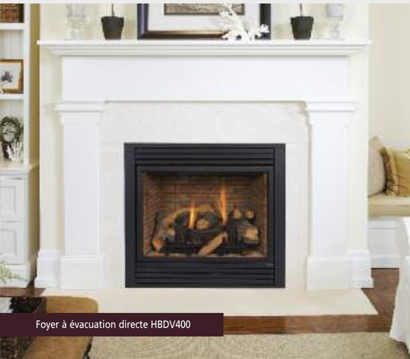
Foyer à évacuation directe HBDV400