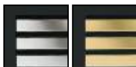
Louveres en étain Louveres en laiton