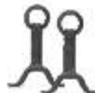
Chenets pour BLDV