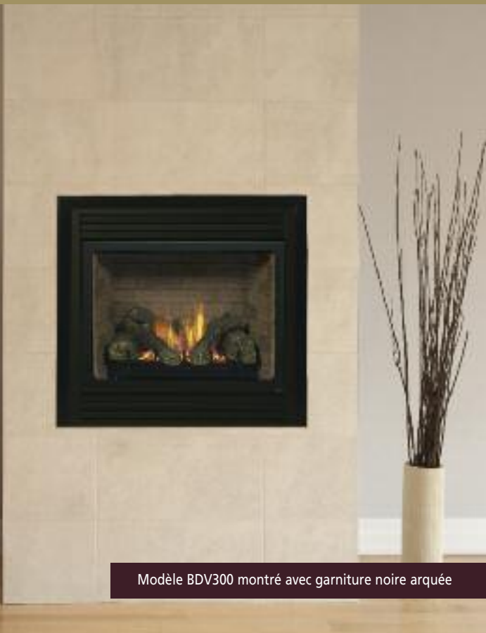
Modèle BDV300 montré avec garniture noire arquée