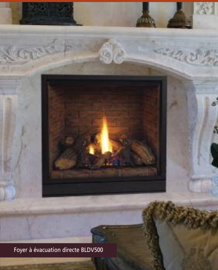
Foyer à évacuation directe BLDV500