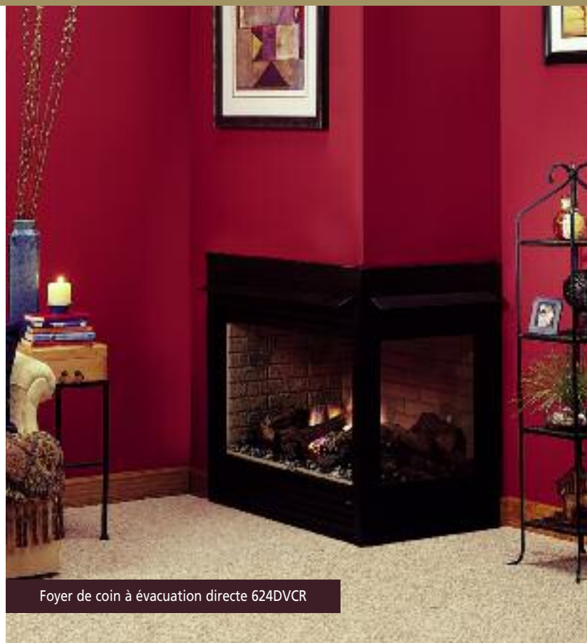
Foyer de coin à évacuation directe 624DVCR