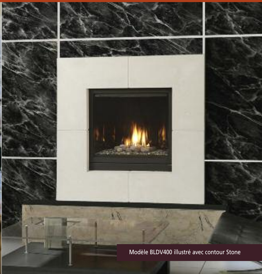
Modèle BLDV400 illustré avec contour Stone