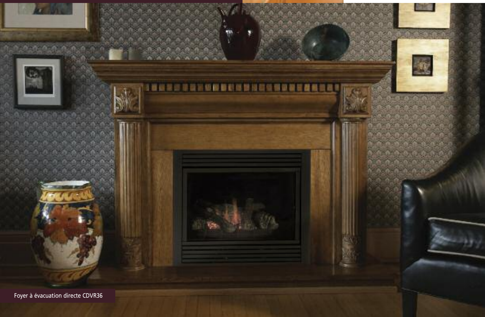
Foyer à évacuation directe CDVR36