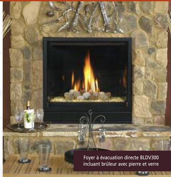
Foyer à évacuation directe BLDV300 incluant brûleur avec pierre et verre

Comme vous pouvez le constater sur la page couverture, le foyer à évacuation directe Belmont BLDV de Monessen offre une allure contemporaine sans louveres pour une surface vitrée optimale. Offert avec les bûches classiques et des panneaux en porcelaine noire, une gamme d'options de briques réfractaires ou notre brûleur avec verre et pierre, le modèle Belmont constitue l'ajout parfait à toute pièce moderne. Le modèle Belmont est doté du système Signature Command MC , qui offre un allumage électronique avec bloc-pile auxiliaire (permet d'utiliser votre foyer même en l'absence d'électricité) et sans veilleuse permanente utilisant du gaz même lorsque le foyer est éteint. Le foyer Belmont de Monessen est un choix écoénergétique tout en esthétique.