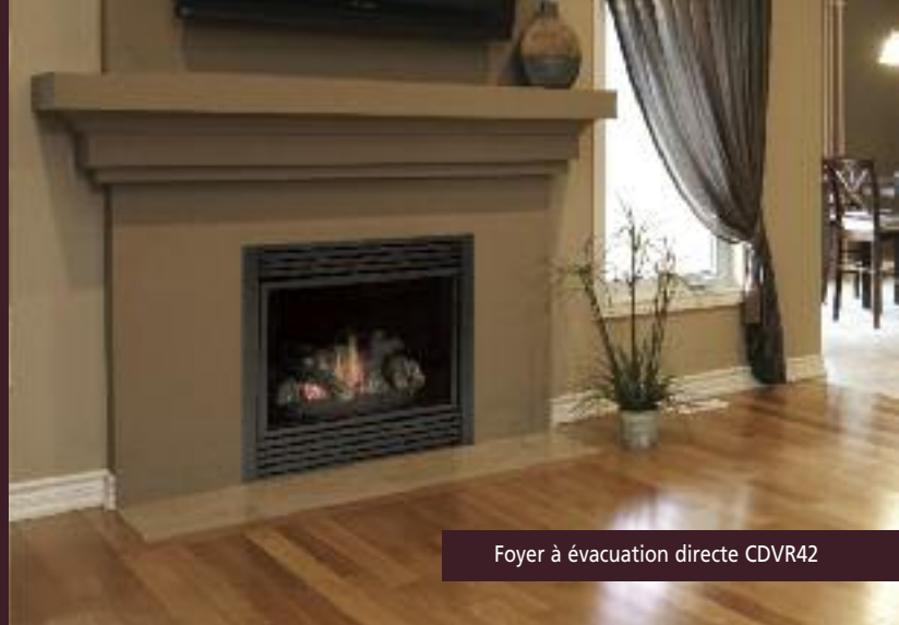
Foyer à évacuation directe CDVR42

Foyer BLDV500 avec vitre pleine grandeur illustré sur la couverture