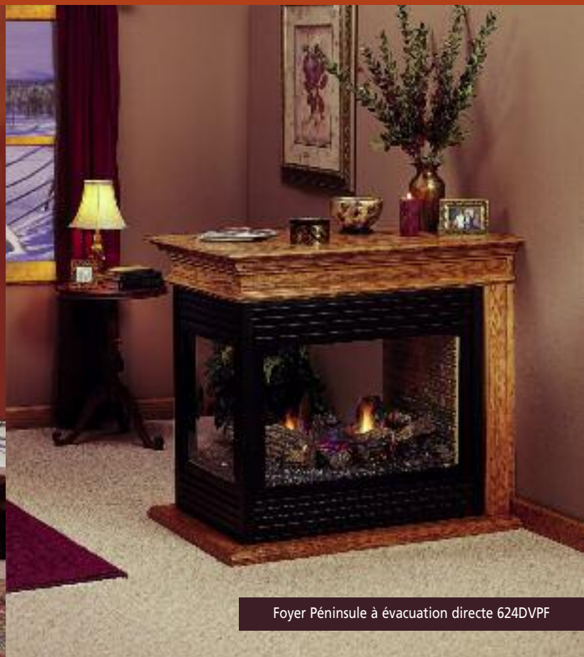
Foyer Péninsule à évacuation directe 624DVPF