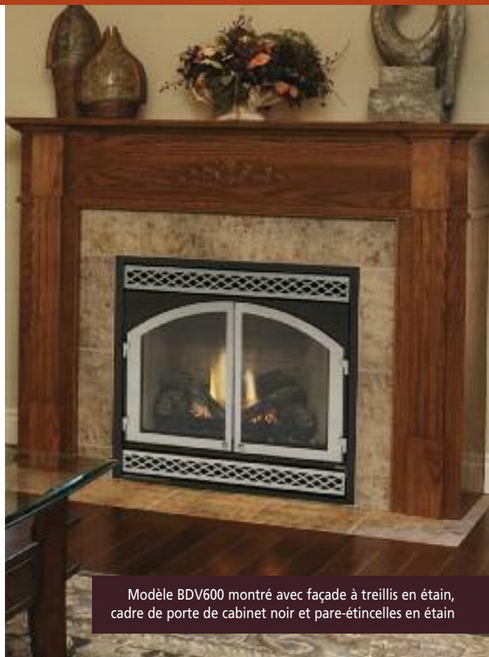
Modèle BDV600 montré avec façade à treillis en étain, cadre de porte de cabinet noir et pare-étincelles en étain

En plus de constituer un ajout de toute beauté à votre domicile, le foyer à évacuation directe de Monessen constitue un excellent moyen de chauffer des pièces qui semblent perpétuellement froides et humides, sans devoir chauffer l'ensemble de votre maison. La série de foyers BDV offre des foyers de style classique en différentes dimensions. Profitez de la douce lueur des flammes avec des surfaces vitrées de 486 à 795 po 2 (3 135,5 à 5 129 cm 2 ) et de la chaleur dégagée par des foyers de 15 000 à 26 000 BTU. Votre foyer BDV est tout simple à utiliser grâce au système de commande Signature Command MC , désormais offert avec tous les modèles BDV. Tous les foyers BDV sont vendus avec des louvres noirs standard, mais vous pouvez choisir entre une vaste gamme d'accessoires et de finitions en option pour personnaliser votre foyer à évacuation directe BDV de Monessen afin de l'intégrer harmonieusement à votre décor.